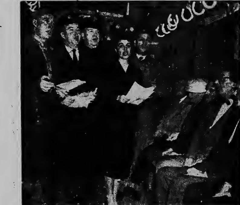
Den e deluster dianan aki ya ta custumber caba, cu ora bo ta den un trein ta bayendo un otro lugar, di ripiente canticunan di pascu ta cuminsa zona di tur banda for di boznan di e empleadonan di e trein, como pascu ta yegando. Aki riba nos por mira cinei di nan bou di cantanan di pascu. I sinta riba e banki..... algun pasahero, sintiendo nan mes un poco strango. Bon pascu!

ULSTER — Den warda di polis di Ulster, na frontera di republica Irlandes cu Ulster, territorio Ingles, a explota un bom ajera. E noticia no ta haci mencion di morto u otro victima.